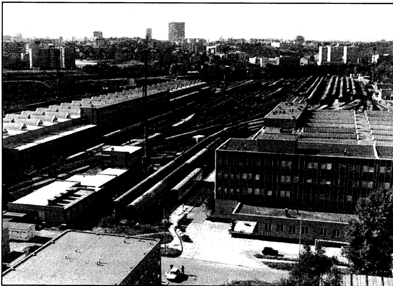
Smutný je pohled na střední skupinu provozního souboru zvaného odstavné nádraží Praha jih (ONJ), které organizačně spadá pod žst. Praha hl. n. Tohle komunistických plánovačů mělo zajistit plynulé provozní ošetření obrátových souprav ze žst. Praha hl. n. V současné době, kdy železniční doprava neustále a rychle upadá, je ONJ jako celek téměř nevyužitý, a proto slouží hlavně k odstavení správkových a vyřazených osobních vozů, které se zde ještě „dodělají“. Nejhorší je fakt, že díky téměř nulovým investicím celý areál rychle chátrá. Na snímku vpravo hala JLV, která z poloviny slouží jako sklad potravin soukromého velkoobchodu (netřeba dodávat, že dováženo a vyváženo těžkými kamiony). V největším objektu ONJ (na snímku vlevo) se udržují a opravují osobní vozy DKV Praha.